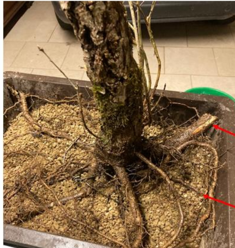
Grosse racine coupée